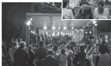
東京タワー点灯式(2019.4.2)